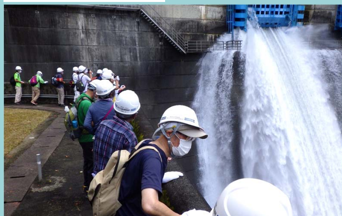
ゲート点検放流を望む