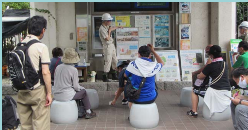
天ヶ瀬ダムの説明