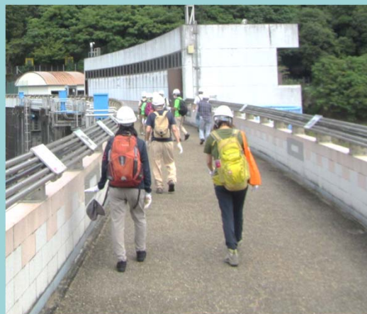
ダム見学スタート（堤頂通路）