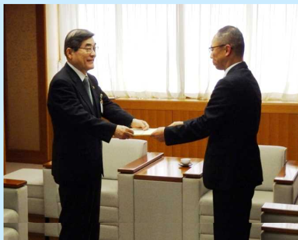
【伝達式】登録証を手渡りする