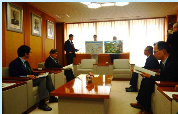
宇治市天ヶ瀬ダムかわまちづくりの概要説明