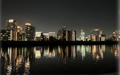
梅田夜景クルーズ