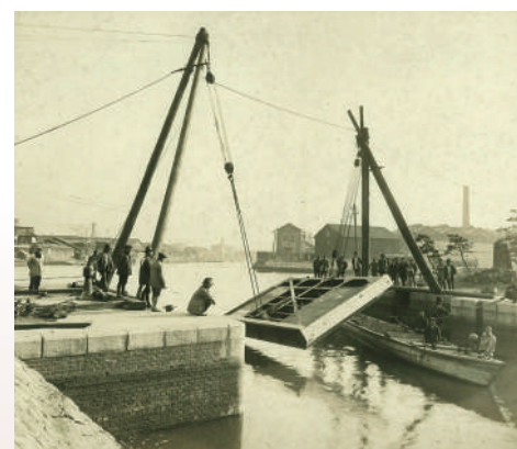
六軒屋第一閘門扉取り替え