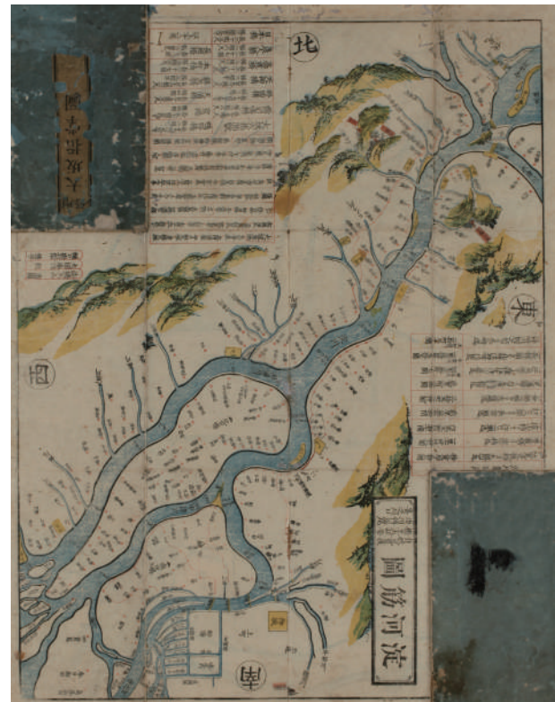
淀川筋図 自伏見豊後橋至大坂安治川伝法尼崎之川口