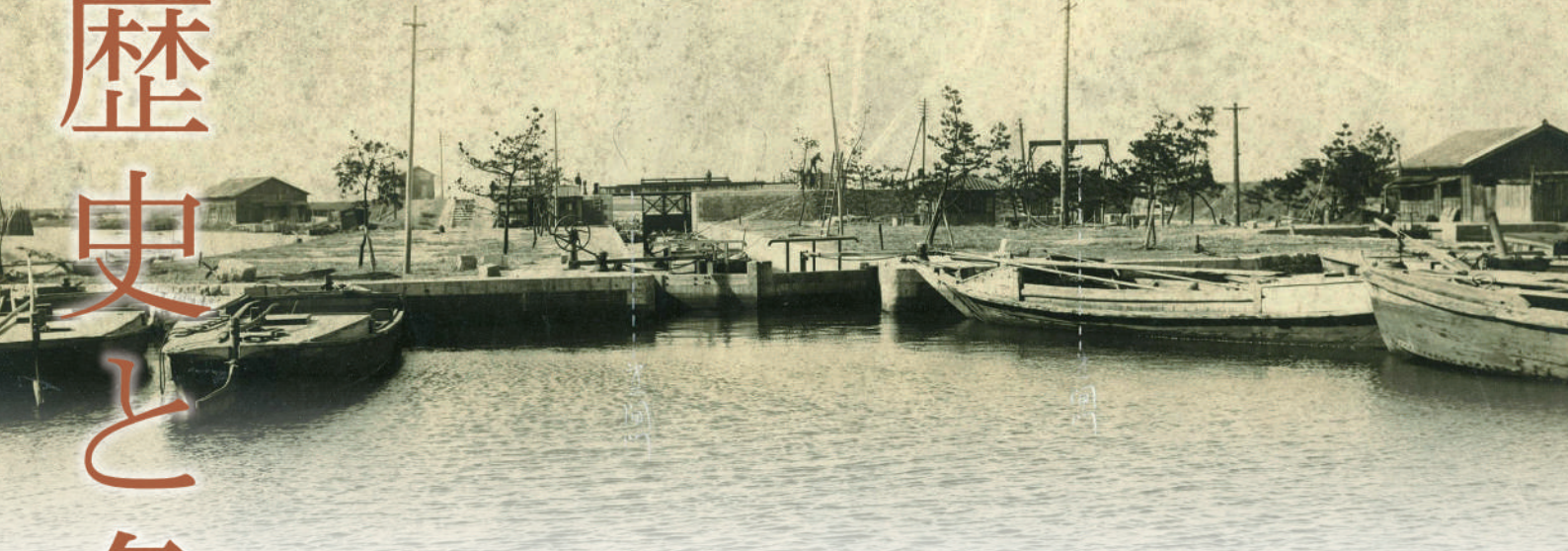
伝法第二閘門全景