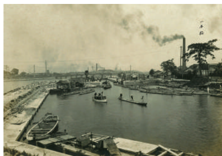
完成した毛馬第二閘門と船溜まり