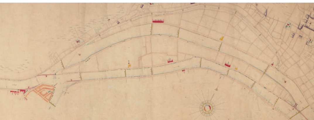
從天神橋至安治河口實測三千分個之一縮図 則以曲尺式寸為一百間、乃至志間者六尺也