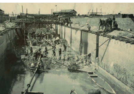
毛馬第一閘門工事中の状況