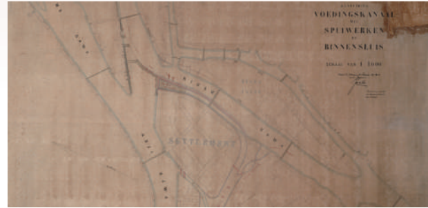
第十九号 外国人居留地近傍内築図