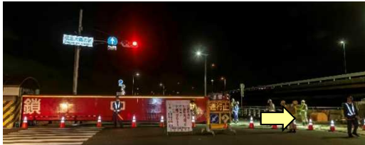
でんぼうりっこう 伝法陸閘 閉鎖作業中 1時20分 (国道43号 伝法大橋右岸)