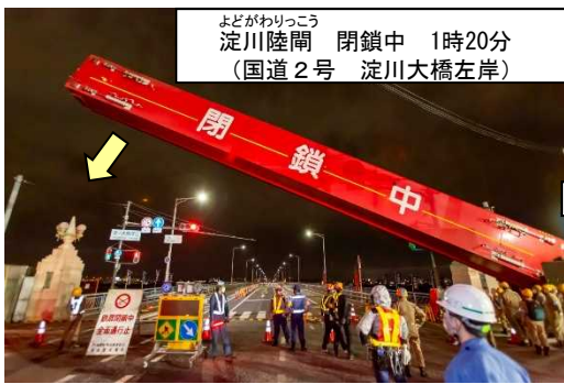
よどがわりっこう 淀川陸閘 閉鎖中 1時20分 (国道2号 淀川大橋左岸)