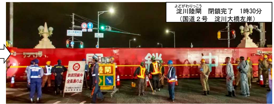
よどがわりっこう 淀川陸閘 閉鎖完了 1時30分 (国道2号 淀川大橋左岸)

■実施日： 令和4年7月2日（土）22：30～3日（日）3：00 (交通規制7月3日（日） 1：00～2：30)