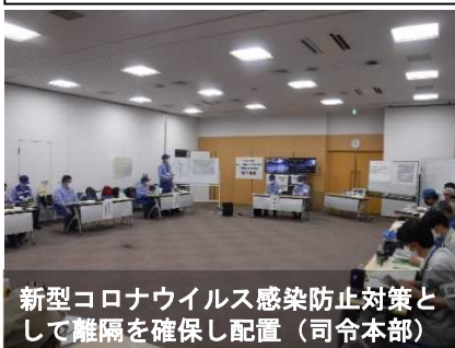
新型コロナウイルス感染防止対策として 隔離を確保し配置(司令本部)