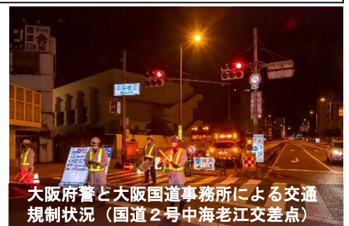
大阪府警と大阪国道事務所による交通 規制状況(国道2号中海老江交差点)

防潮鉄扉の閉鎖は鉄道や幹線国道等の通行止めを伴うため、本番さながらの訓練を年に1度実施するとともに、閉鎖後に点検を実施しています。新型コロナウイルス感染防止対策に配慮した上で、訓練・点検を実施しました。