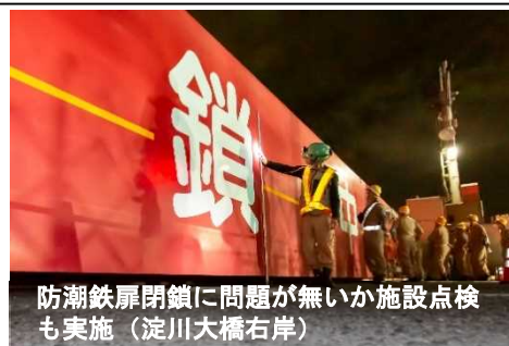
防潮鉄扉閉鎖に問題が無い か施設点検も実施(淀川大橋右岸)