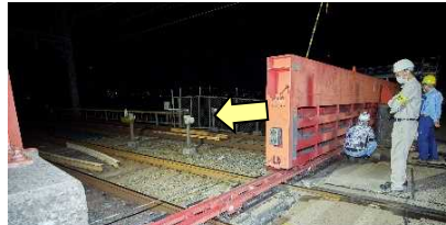
はんしんりっこう 阪神陸閘 閉鎖作業中 1時20分 (阪神なんば線淀川橋梁左岸)