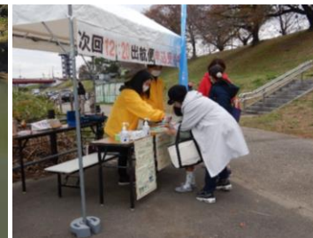
受付時には検温・消毒を徹底