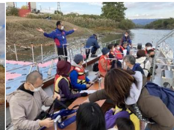
最大定員20名の船で運航