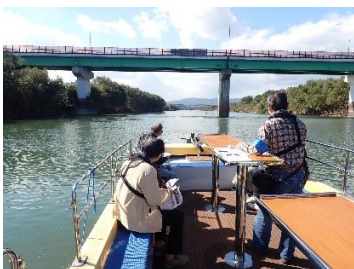
河川レンジャーによるガイド