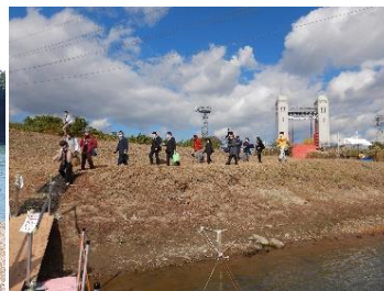
三栖閘門仮設船着場にて乗船