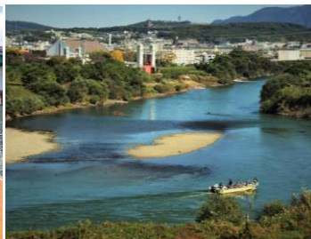
水深に注意して航行（*）