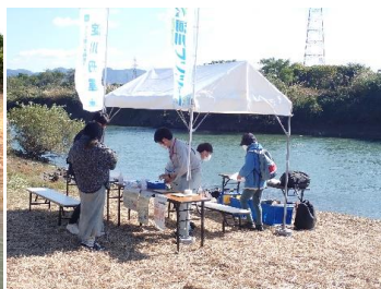
三栖閘門仮設船着場の受付