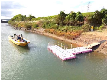
三栖閘門仮設船着場