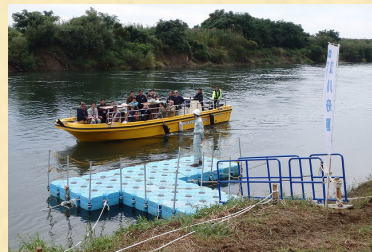
▲三栖閘門仮設船着場 (イメージ)