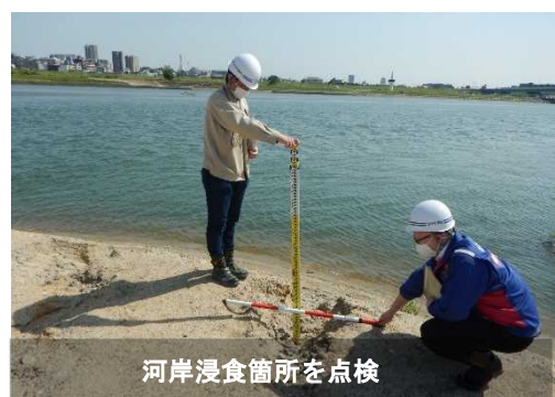
河岸浸食箇所を点検

事務所職員が、河川堤防および河川施設を個別に点検し、危険な箇所を洗い出しました。