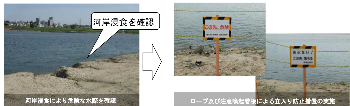
河岸浸食により危険な水際を確認