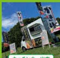
キッチンカー出店