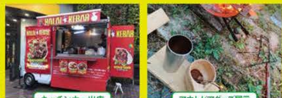
キッチンカー出店