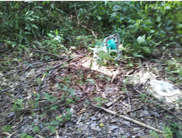
バーベキュー網です。