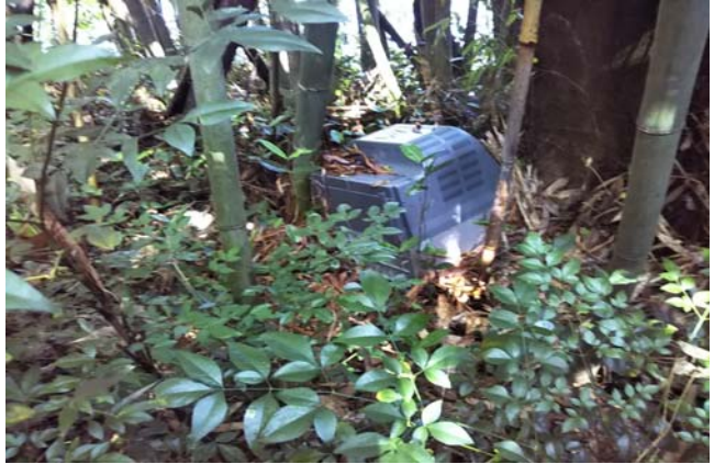
竹藪の中から見えた木津川です。