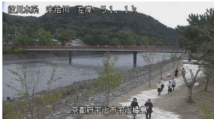
インターネット配信映像より引用

しかしながら、範囲があまりにも広域ですので監視カメラを設置するにしても限界があり即効性の ある打ち手を皆で考え行動する必要性を痛感しています。