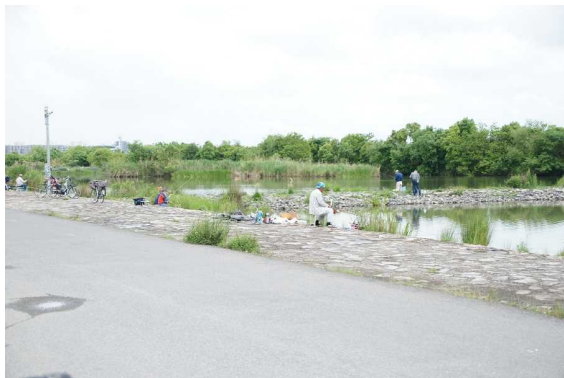
【釣りを楽しむ人人】