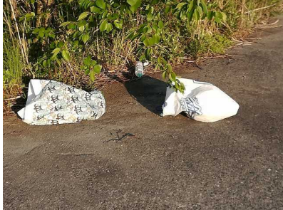
淀川右岸 9.7 km付近 淀川ゴルフクラブ西端付近