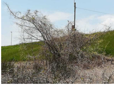
淀川ゴルフクラブ東端近く、下流約 10 キロ付近

8月のレポートの、不気味な洞窟のようになった植物です。冬の間ですっかり葉を落とし、こんな姿になっていました。面影はあるものの、あまりの違いに驚きました。また梅雨の頃から緑の葉が息吹くのでしょうか。