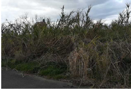
横倒しになった植物

1月27日には、台風のような猛烈な風が吹き荒れていました。河川敷のあちこちで、その影響を受けた植物の姿が見られました。