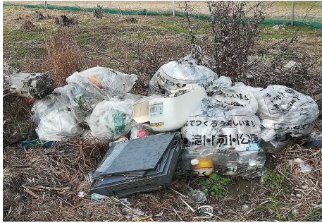
淀川右岸 9.3 km付近