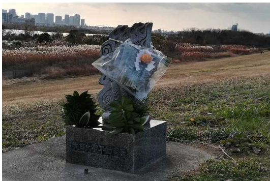
淀川右岸 11.5 km付近 大日大聖不動明王

大日大聖不動明王には、お正月のしめ飾りが飾られており、微笑ましい光景でした。ここは日頃から、散歩がてら手を合わす人の姿をよく見かけます。どなたかが飾られたのでしょうか。