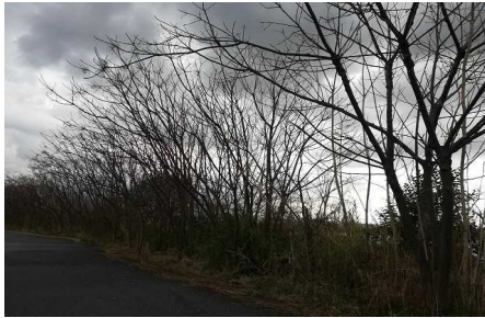
すっかり葉を落とした木々

暑い盛りには、葉っぱをぎっしりとつけて、重そうに垂れ下がっていた木々です。今はすっかり葉を落として、あちら側が見えている状態です。これは強風の影響というより、季節的なものでしょう。季節によって全く違う顔を見せてくれます。