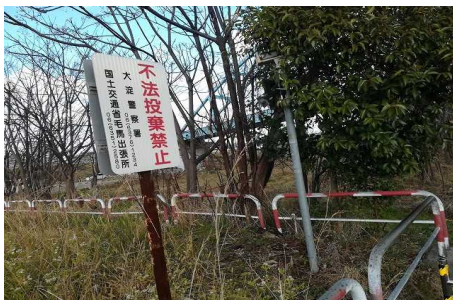
淀川右岸 9.4 km付近