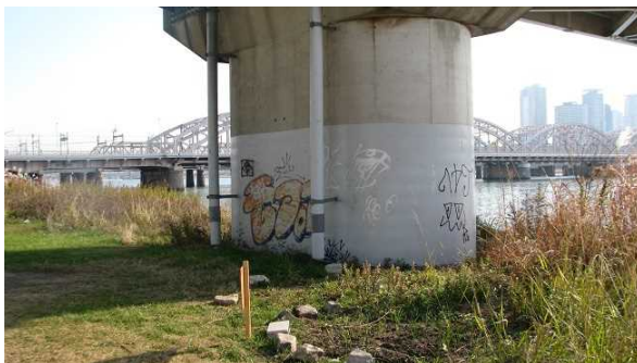
⑮ 十三大橋橋脚 落書き