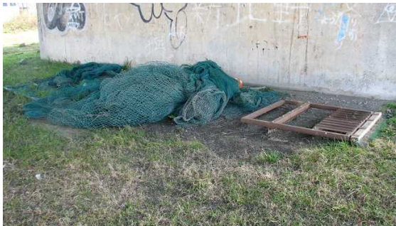
⑬ 新十三大橋橋脚とNTT十三専用大橋橋脚の間の河岸 流木あり2か所