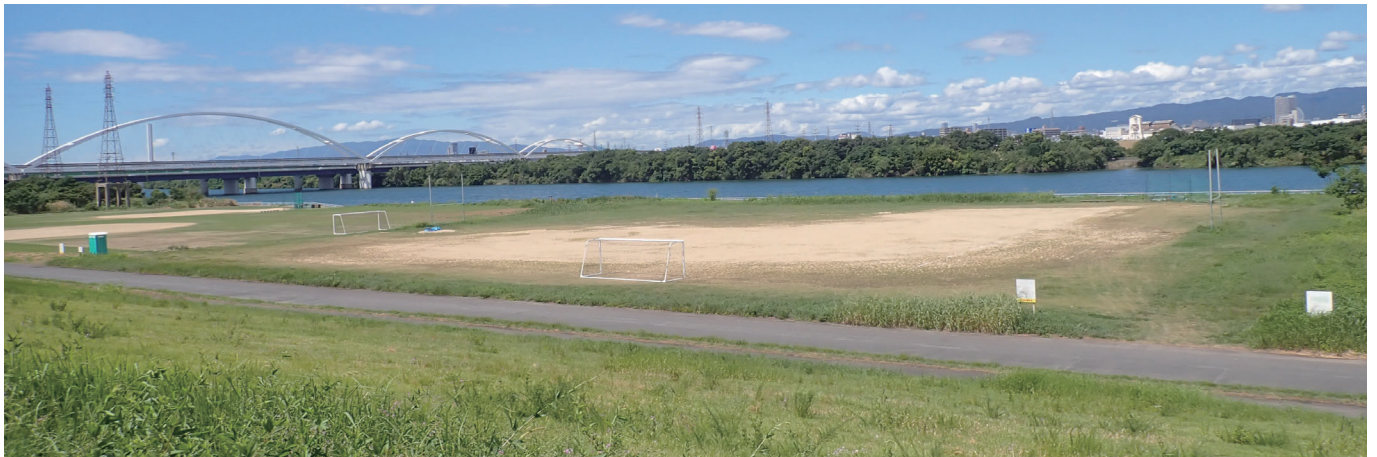
守口市淀川河川敷運動広場（守口市）（令和5年9月）