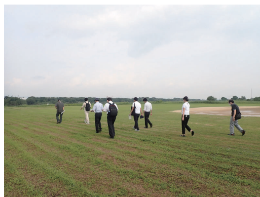
No. 14 守口市淀川河川敷運動広場