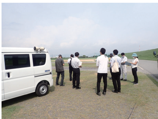
No. 13 運動広場