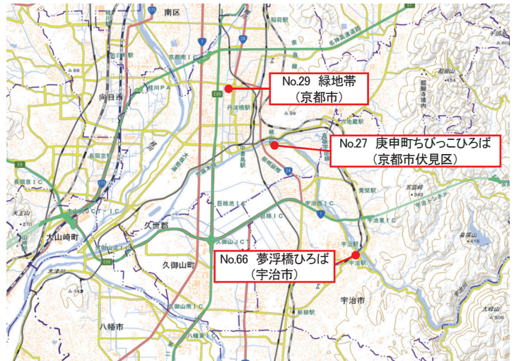
審議対象案件 位置図