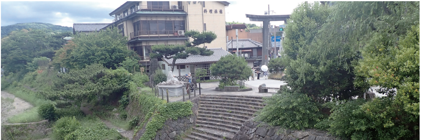
夢浮橋ひろば（宇治市）（令和4年6月）