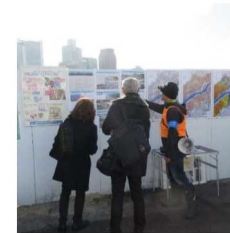
産学官連携防災イベントへの出展、浸水歩行体験とパネル展示を開催 大阪市北区