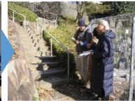
地域の方と一緒に避難所へのルートを歩きながら、避難時の危険箇所をチェック