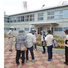
治水事業への理解を深める住民見学会などを開催 大阪市城東区