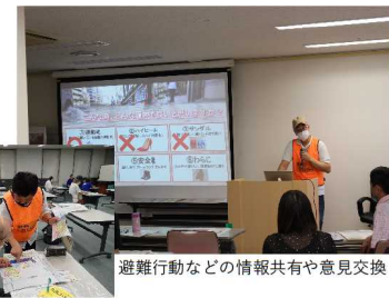
避難行動などの情報共有や意見交換

過去に作成支援を行った地域(全域ではなく一部の自治会、学校) 京都市伏見区、宇治市、城陽市、八幡市、大阪市北区・淀川区、高槻市、枚方市、守口市