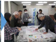
チェックしたところをマップに記載し、より安全に移動できるルートをつくります。

過去に作成支援を行った地域(全域ではなく一部の自治会、学校) 京都市伏見区、八幡市、大阪市北区・淀川区・都島区、高槻市、枚方市