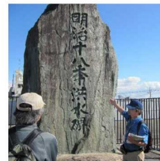
自然災害碑で過去の水害を伝え、現在の治水事業やハザードを学ぶ探訪ガイド 枚方市