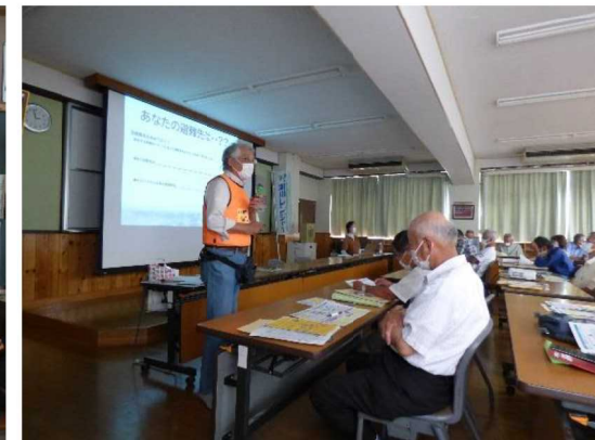
マイ・タイムライン等に関するワークショップ