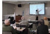
地域のリスクをハザードマップを見ながら学習します。(自治体の方にお願いする時もあります)

「マイ防災マップ」とは、ハザードマップで地域(自宅)～避難所までの経路を実際に歩いて危険箇所を確認し、安全な経路をマップに反映するものです。