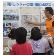
公民館主催事業への企画～出展協力。展示パネル貸し出しなども可能 高槻市