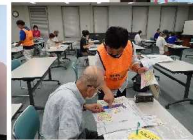
マイ・タイムラインの作成