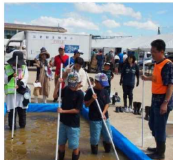
自治会などの防災訓練に出展 浸水地歩行体験を行うとともに 早期避難を啓発 宇治市