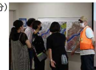
浸水想定継続時間の解説