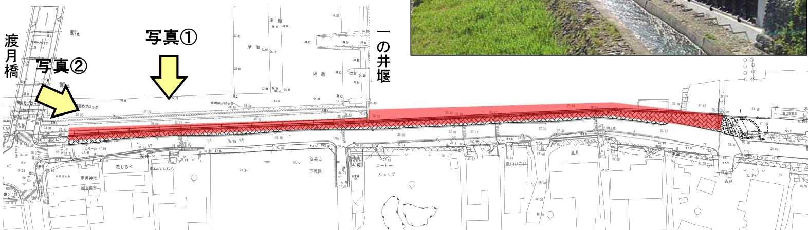
【一の井堰下流区間】