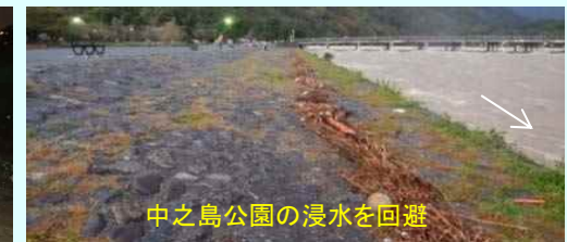
中之島公園の浸水を回避