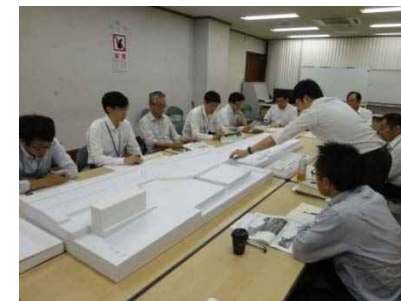
行政三者会議の様子