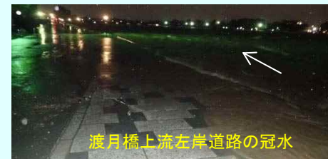
渡月橋上流左岸道路の冠水