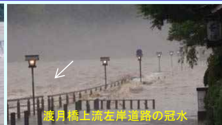
渡月橋上流左岸道路の冠水