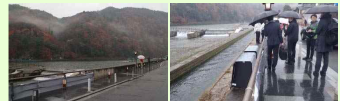
現地確認状況（ロール紙、実物模型を現地に設置）