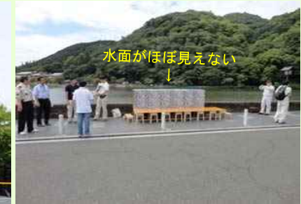
パラペット模型の現地確認（第5回地元検討会）