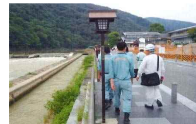
道路管理者との現地確認