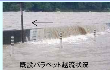
既設パラペット越流状況