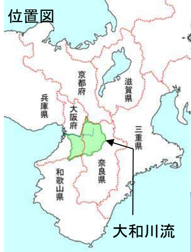
(参考図) 大和川水系図