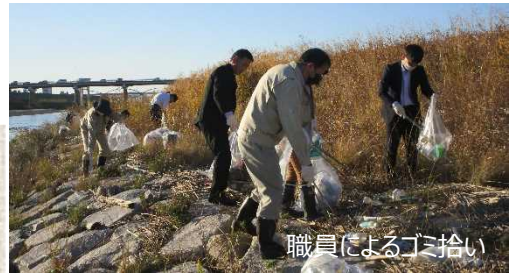
職員によるゴミ拾い