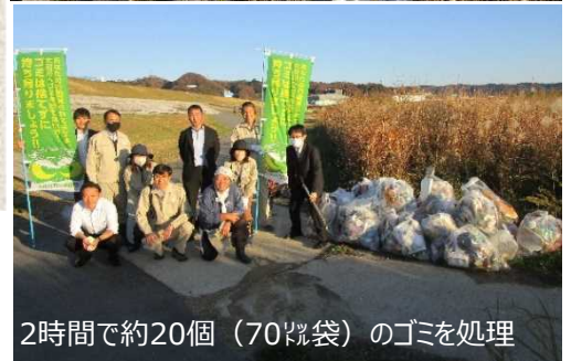
2時間で約20個（70%袋）のゴミを処理