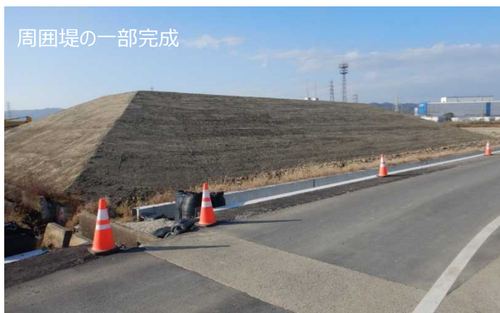
周囲堤の一部完成