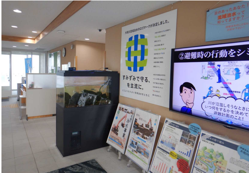
大和川河川事務所1階ロビー