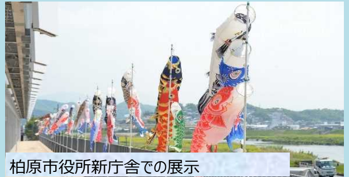
柏原市役所新庁舎での展示

○連休中には、柏原市役所前の河川敷で柏原市河川空間のオープン化イベントとして、「アス・アースフェス」や「日本の食まつり」が開催されます。