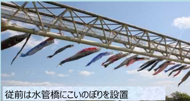
従前は水管橋にこいのぼりを設置

柏原市では平成8年度から大和川に架かる高井田付近の水管橋に約100匹のこいのぼりを泳がせ、大和川に親んでもらえるよう「こいのぼりまつり」を実施しております。令和3年の和歌山市での水管橋崩落事故を受け、昨年より場所を市役所本庁舎に移して、本庁舎2階テラス通路に小さなこいのぼりを泳がせます。令和5年度は、4月19日（水）から5月11日（木）まで開催いたします。