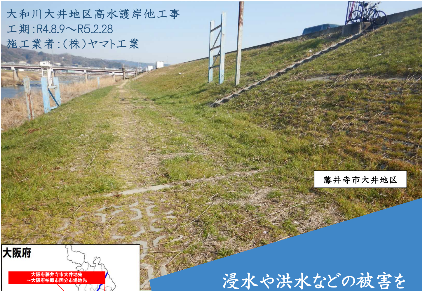
藤井寺市大井地区

大和川大井地区高水護岸他工事 工期：R4.8.9～R5.2.28 施工業者：(株)ヤマト工業