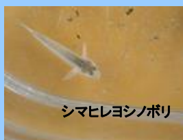
シマヒレヨシノボリ