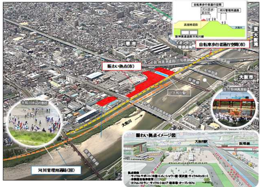
▲堺市かわまちづくりイメージ