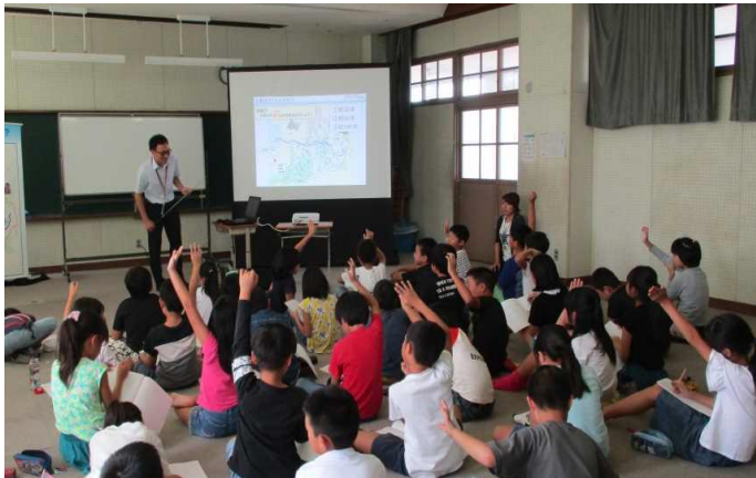
参加型の講座の様子