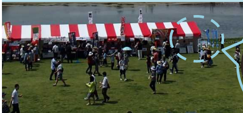
▲ 事務所のブースの様子