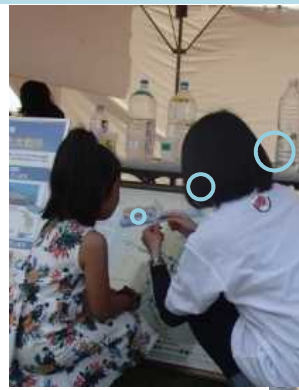
▲ 水質の実験中・・・