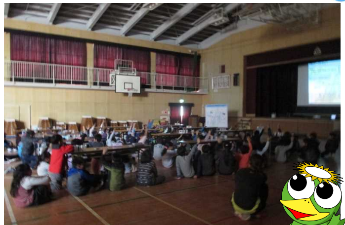
大和川クイズに挑戦中！