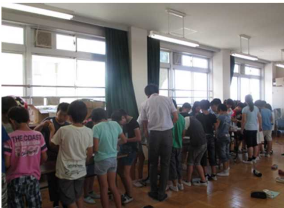
水の汚れを調べる実験中...