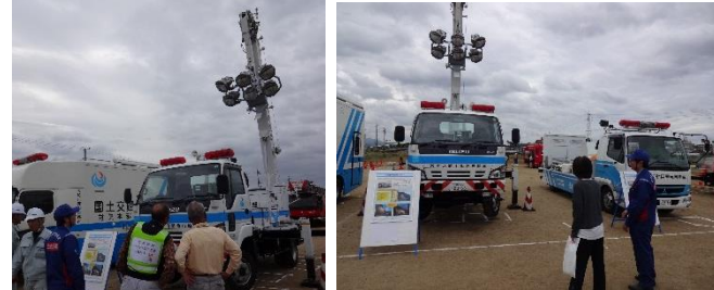
照明車、排水ポンプ車、災害本部車紹介