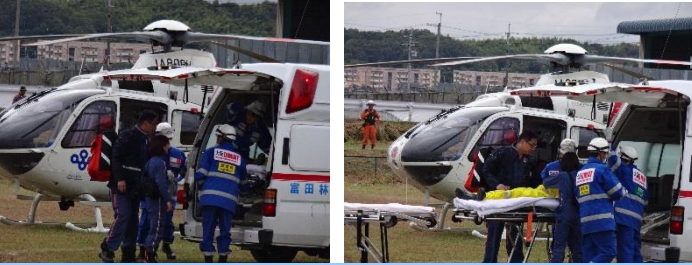
D-MAT隊・ドクターヘリによる負傷者の搬送