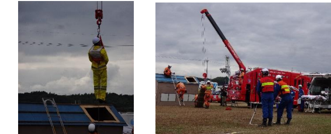
消防団特殊技能隊・救助隊・自主防災組織による救助活動