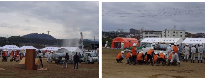
水道管破損復旧作業