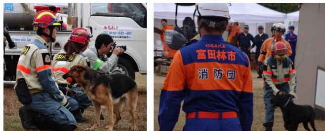
災害救助犬による要救助者捜索