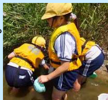
▶木の根っこや岩の下にいる生き物をさぐって探します