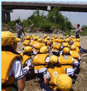
▲川に入る前に説明を聞く生徒たち