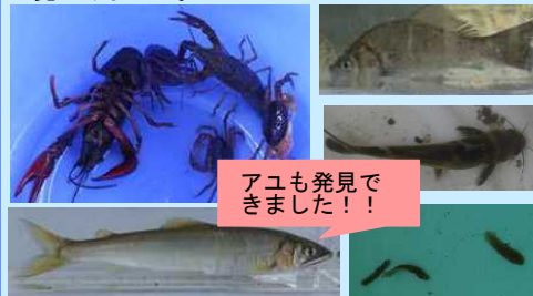
アユも発見できました！！

フナやギギなどの大きな魚から、ナミウズムシといった小さな生き物まで色んな生き物を見つけました。