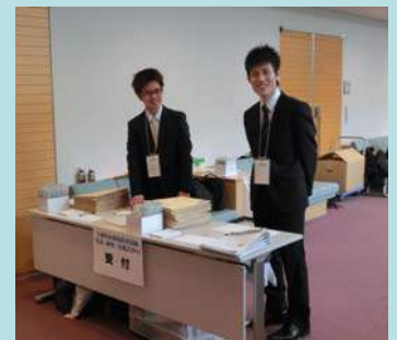
大阪市立大学の学生さんに 受付を手伝ってもらいました。