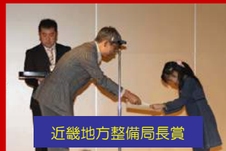
近畿地方整備局長賞