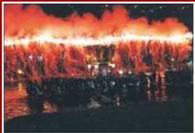
●近畿地方整備局長賞