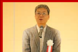
近畿地方整備局より 開会のご挨拶