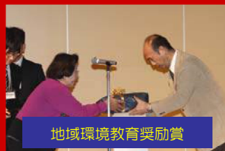
地域環境教育奨励賞