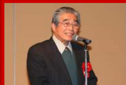
審査委員長より 審査講評