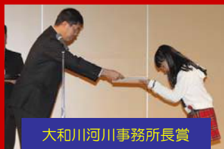
大和川河川事務所長賞