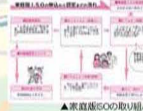
▲家庭版ISOの取り組み