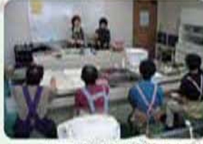
▲エコクッキング教室の様子