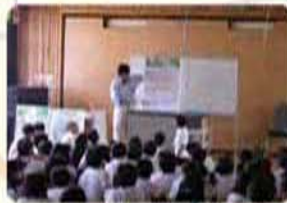
▲出前出張講座の様子