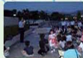
▲ふる里ウォッチングの様子