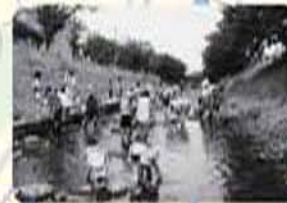
▲リバーウォッチング親子の集いの様子