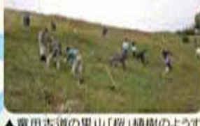
▲菟田古道の里山「桜」植樹の様子