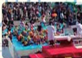
▲香芝ふれあいフェスタの様子