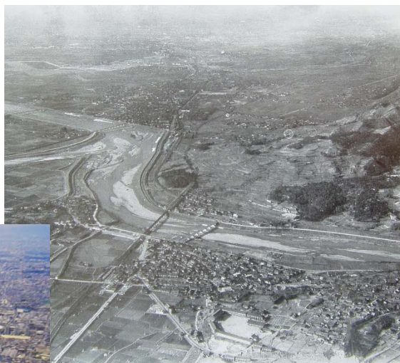
昭和30年代の大和川、石川合流点

大和川における自然再生は、河川環境の整備を行い、過去に損なわれた良好な河川環境の再生を目指すものである。整備後においても河川環境の変化をモニタリングし、必要に応じて計画にフィードバックさせながら、段階的な整備を行っていく。