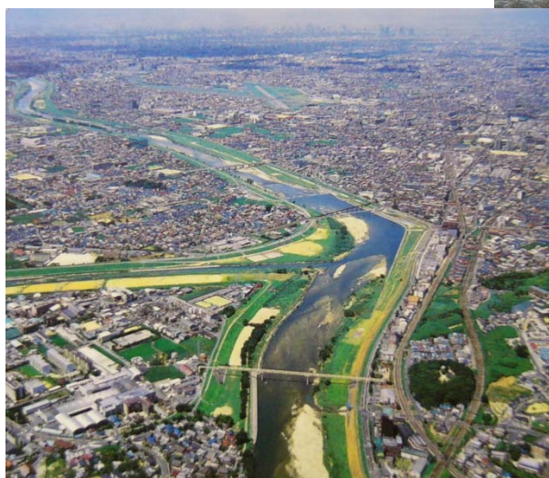
平成13年の大和川、石川合流点