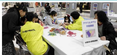
アクリルタワシ作成ブースの様子

■ 1Fノースコートでは、大和川について工作や実験を通して楽しく学ぶコーナーを実施しました。