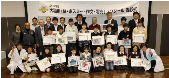
大和川コンクール表彰式の記念撮影