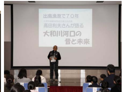
高田さんによる大和川のお話

■ 賞状授与の際のインタビューでは、子どもたちの作品への想いや受賞しての感想など、みんな元気に答えてくれました！