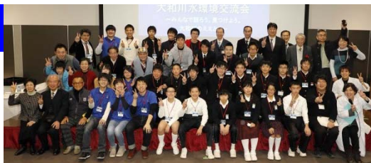
交流会の記念撮影

■ 7団体が集まり、それぞれ活動の中で気付いた「めっちゃええやん大和川」を発表してもらい、交流を深めてもらいました。