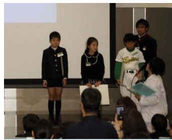
インタビューの様子