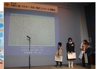
インタビューの様子

●ポスターの部 奈良県知事賞 ●絵の部 大阪府知事賞 ●絵の部、ポスターの部 近畿地方整備局長賞