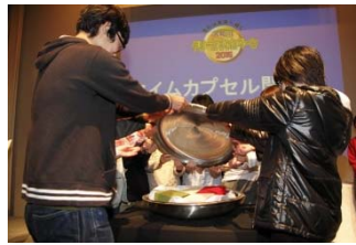
みんなで開けました！