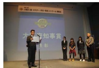
表彰状授与式の様子