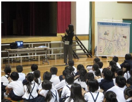
講師の説明を熱心に聞く子供達の様子

大和川について、習ったことをしっかり覚えている生徒さんがたくさんいて嬉しかったよ！大和川の付け替えの歴史についても皆たくさん勉強することが出来たね！講義の後にも大和川について積極的に質問してくれて、熱心に聞いてくれてありがとう！今回の講義で習ったことをもとに大和川についてたくさん興味を持ってみてね。