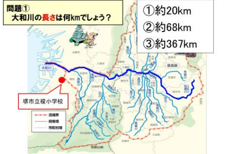
①大和川の概要(基本情報など)