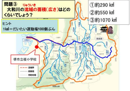
①大和川の概要(基本情報など)