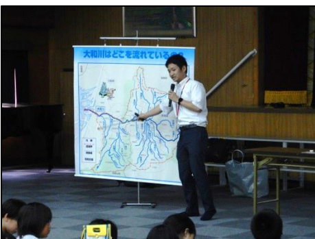
ベテラン講師による講義の様子

大和川について、詳しい生徒さんがたくさんいて嬉しかったよ！ パケットの結果は意外なものだったね。たった一滴の醤油で汚れてしまうことが分かったと思うので、もっときれいな大和川にできるよ、みんなで頑張っていこうね！