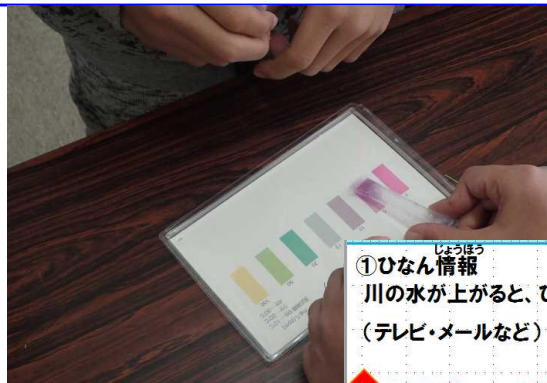
パックテストの様子