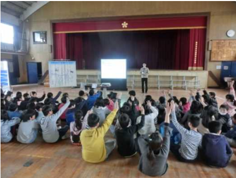
大和川クイズに挑戦中！