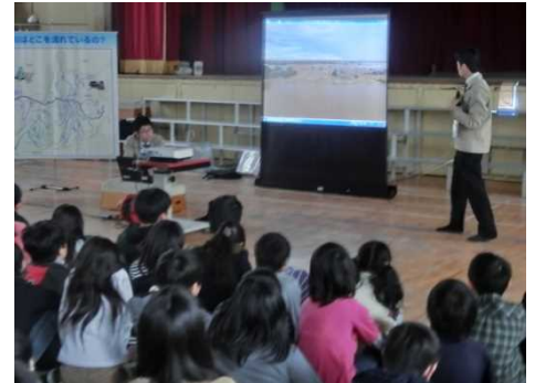
鬼怒川の映像も見ました

治水の分野では、みんなにはある村の村長さんとして、洪水を防ぐにはどうしたらいいか考えてもらいました。質問に対して積極的に手を挙げてくれる子がたくさんいました。本日は歴史と防災のお話をしましたが、また次回に環境(ゴミ問題や川の生き物、水質の簡単な実験)のお話もしたいと思います。