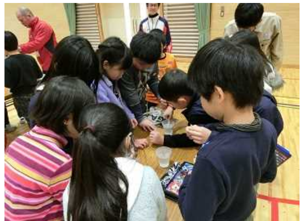
パックテストによる実験の様子