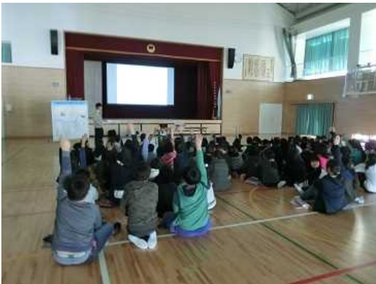
皆さんよく手が挙がります

今回、私たちのお話を聞いてくれたのは藤井寺市立藤井寺小学校のみなさんです。大和川の歴史は少し授業で勉強していたようですが、防災や環境など新しい事がたくさん学べましたね。