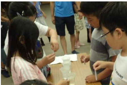
実験はうまくいったかな？