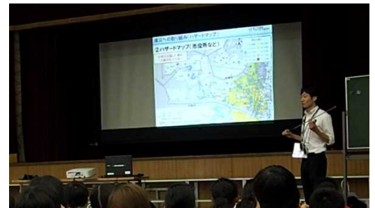
防災教育にも取り組んでいます！

パックテストでは、「A:大和川の水」「B:ペンギン池の水」「C:水道水」「D:水道水+醤油1滴」を使って、水の汚れを実験しました。実験前のみんなの予想では「B:ペンギン池の水」が一番汚いということになりましたが、結果は・・・「D:水道水+醤油1滴」でした。みんなが思っているより、醤油(=生活排水)は川を汚してしまうことに驚いていました。