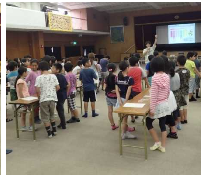
実験の説明はわかったかな？