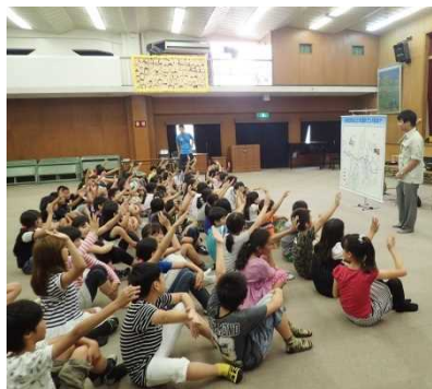
たくさん手を挙げてくれました