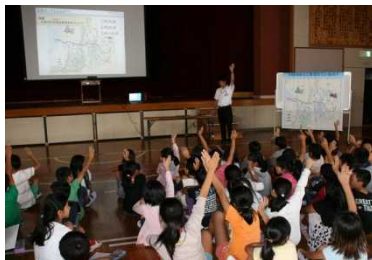
大和川クイズに挑戦中！