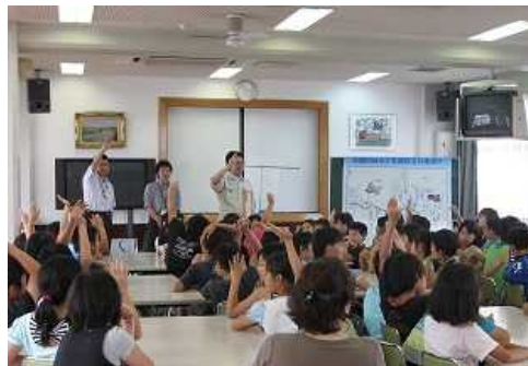
大和川のクイズに挑戦中～