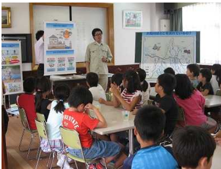
みんな真剣に聞いてくれました！