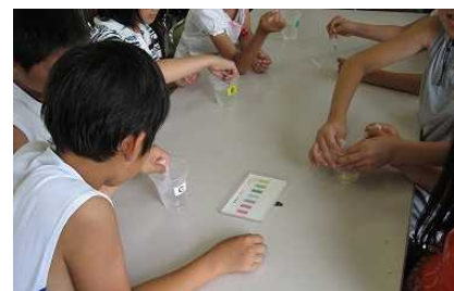
上手く実験できたかな？

これからもその調子でどどん川に興味を持ってくださいね。いつかまた泳げる大和川になるように、「残さない」「流さない」「ふきとる」小さな努力をつみかさねていこうね！