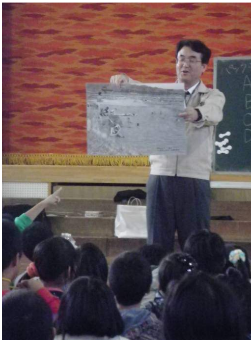
昔は泳げるほどきれいだったんだよ