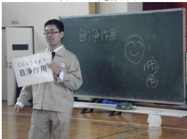
「微生物くん」を例に、自浄作用のお話