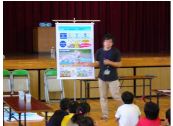
川が持っている力「自浄作用」について