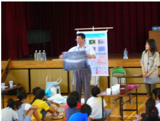
大和川的环境について